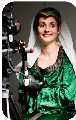
Christine de Pizan