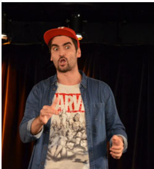
À la Comédie Nation, à Paris.

De La Fontaine à Booba est une comédie surprenante et rythmée qui mélange les genres avec humour !