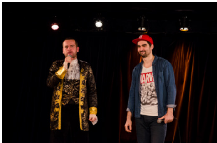
À la Comédie Nation, à Paris.