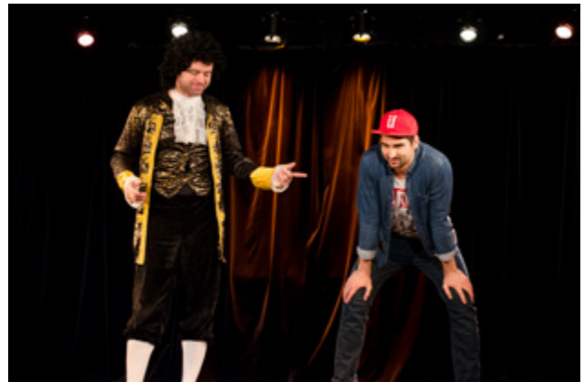
À la Comédie Nation, à Paris.