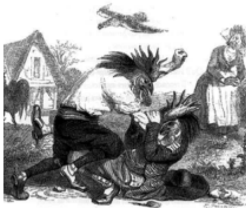
« Les Deux Coqs », illustration des Fables de J.-J. Grandville

Chacun va défendre sa vision à travers les textes : Comment dire une fable au théâtre ? Est-ce que La Fontaine a du flow ? Le rap est-il une forme de poésie ? Peut-on rapper un texte en vers ? Est-ce que Booba vaut Baudelaire ?